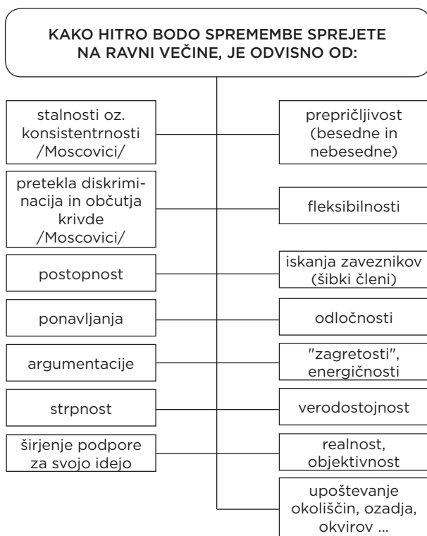
Slika 2: Prikaz temeljnih dejavnikov vpliva manjšine (Vec, 2012)

Tako socialni pedagog, ki se znajde v vlogi manjšine, kot tisti njegovi uporabniki, ki jih okolje dojema kot drugačne, imajo na razpolago številne konstruktivne 2 možnosti in postopke, ki večajo verjetnost, da bo drugačen pogled postal del pogleda širšega okolja: